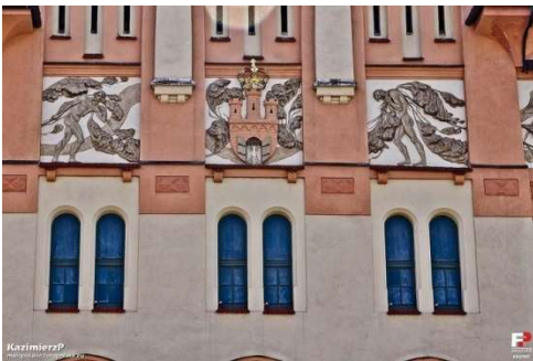
Elewacja Starego Teatru w Krakowie

5. Głównymi reprezentantami secesji byli: Henry van de Velde, René Lalique, Antonio Gaudi, Edward Munch, Gustav Klimt. W Polsce Józef Mehoffer, Stanisław Wyspiański, Józef Pankiewicz skupili się wokół głównego ośrodka secesji - Krakowa.