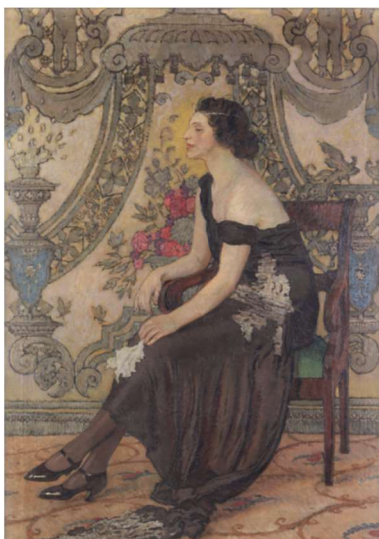
Róża z salonu